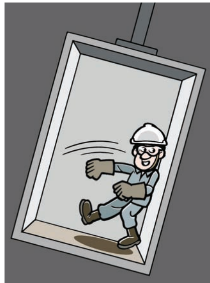
Não balance a cabina.