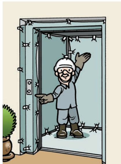
Proteja os marcos e a cabina.