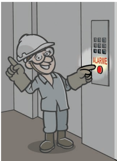
Se faltar luz, aperte o botão de alarme e espere o socorro.