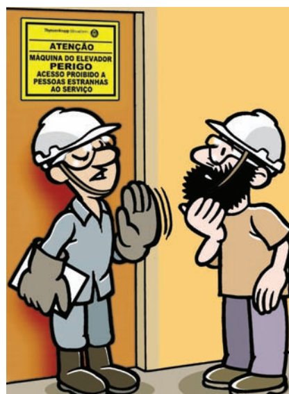
Somente pessoas autorizadas podem entrar na casa de máquinas.