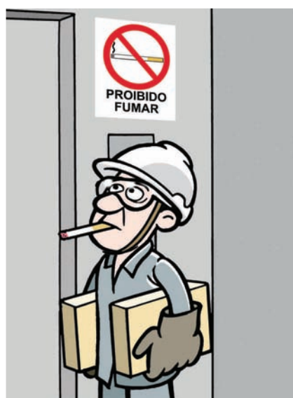
Não fume dentro da cabina.