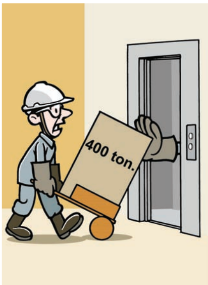
A carga do elevador não pode ultrapassar o peso indicado na cabina.