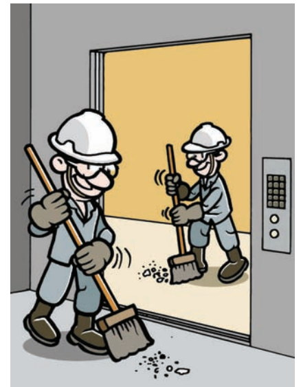
Limpe as soleiras de cabina e do pavimento todos os dias.