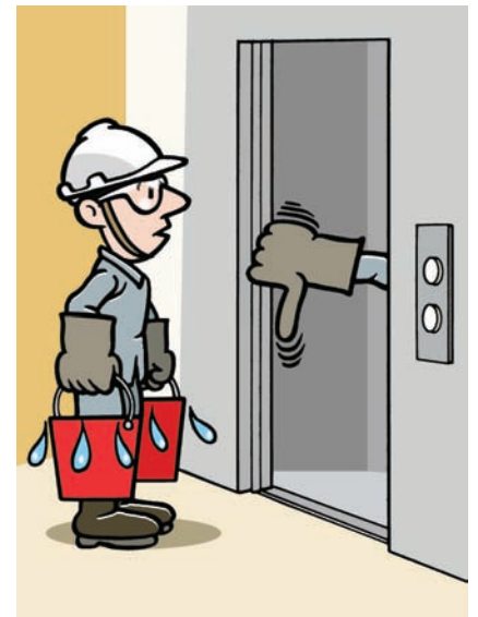
É proibido transportar líquidos na cabina.