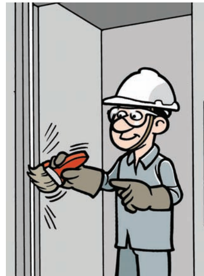
Limpe a régua eletrônica todos os dias com um pincel seco e limpo.