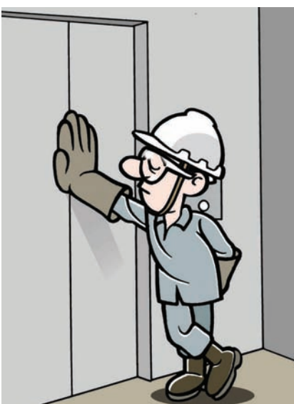
Não force nem se encoste na porta da cabina durante o transporte.